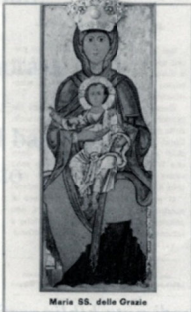
Maria SS. delle Grazie

Il dipinto, liberato della lastra come è attualmente e come era al tempo del trafugamento (1980)