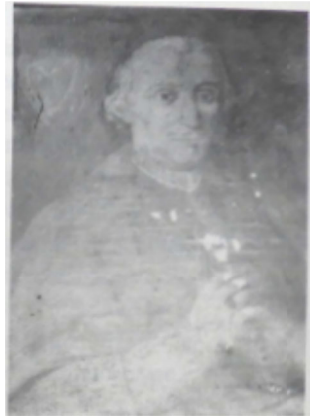
Pomponio De Magistris (Vescovo)