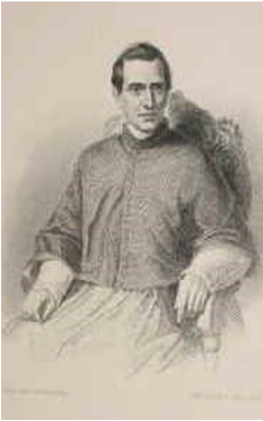
Cardinale Giacomo Antonelli