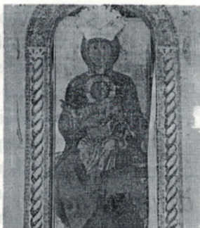
La Madonna delle Grazie trafugata a Sonnino

Non è il caso di parlare di miracolo, ma la forte, spiccata sensazione è tanto da toccare in alcuni momenti scene di frottole, ha sent'altro contribuito, anche se non è stato determinante, a spingere le forze dell'ordine e l'autorità inquirente a mettere in moto tutti i meccanismi necessari affinché gli oggetti sacri trafugati nella chiesa San Michele Arcangelo tornassero in meno di ventiquattro ore al loro posto.