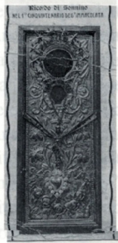
Immagine di Maria SS. delle Grazie, come veniva venerata un tempo, ricoperta da una lastra d'argento finemente lavorato.